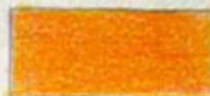
orange (rød + gul)

De to farver som ligger under hinanden kaldes kontrastfarver . Kvart farver består af en grundfarve og en blandingfarve der består af de to andre grundfarver. De kaldes kontrastfar- ver fordi de er så forskellige som to farver kan være