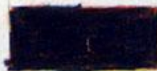
sort gul + lysrød + mørkeblå

Skis man blander alle tre grundfarver sammen får man brun eller grå (sort) farver