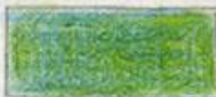
grøn (blå + gul)