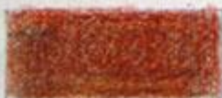
brun mørkeblå + lysrød (gul)

De to farver som ligger under hinanden kaldes kontrastfarver . Kvart farver består af en grundfarve og en blandingfarve der består af de to andre grundfarver. De kaldes kontrastfar- ver fordi de er så forskellige som to farver kan være