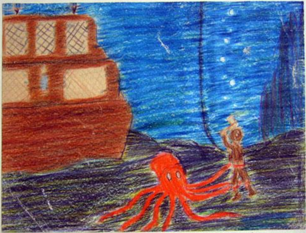
Skib under vand