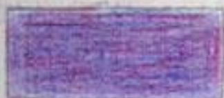
violett (blå + rød)